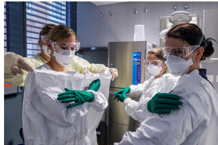
Framework for Action on Interprofessional Education & Collaborative Practice (WHO 2010)