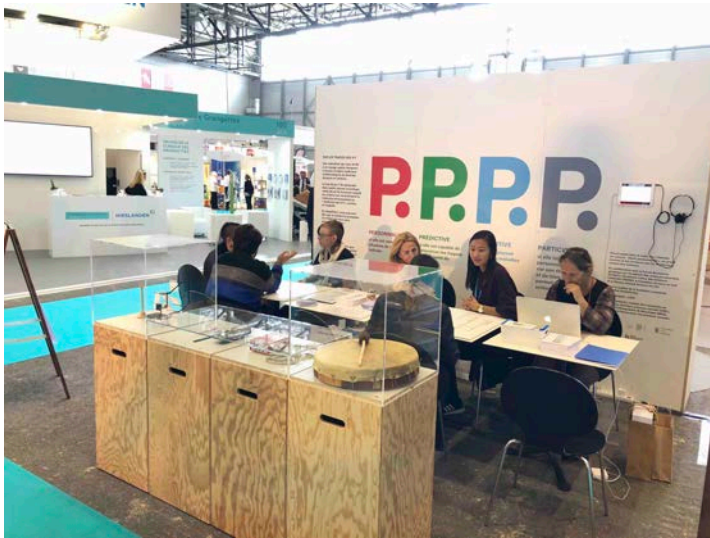
Animation des 4P en live

à la bonne intersection. Plusieurs itérations étaient souvent nécessaires pour arriver à trouver le bon emplacement, l'occasion pour les animateurs de discuter de la définition de la médecine de précision, par comparaison avec des pratiques médicales issues d'autres époques et d'autres cultures.