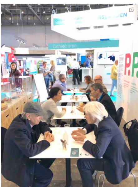
Speed dating sur le stand de Planète Santé