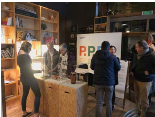
Stand des 4P dans le hall de la Ferme Asile le 21 février 2019

En plus du débat, le public a pu découvrir et participer à l'animation des 4 P qui avait été installée dans le hall d'entrée.