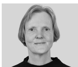
Cornelia Specker Administration